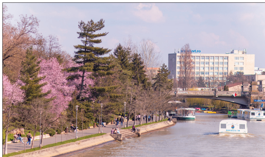
UVT im Frühling

Die Schönheit des Stadtzentrums erinnert mich an meine Heimat. Auch wenn der Stil der Gebäude anders ist, ist die Organisation des Raums ähnlich wie in Italien: elegante Plätze, das Opernhaus und die Kathedrale. Die interessanteste Erfahrung, die ich gemacht habe, war wahrscheinlich ein Konzert: Es wurde vom Rotary-Club organisiert und ich wurde von italienischen Freunden eingeladen. Die Sänger waren ein Bariton, ein