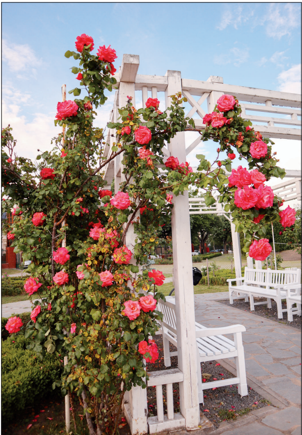
Der Temeswarer Rosenpark

Ohne die Orkane der Vergangenheit ohne stummes Geschrei in der bösen Wirklichkeit ohne Versprechen, die sich später als Lügen herausstellen ohne sich die Wüste der Hölle vorzustellen kann man sich nicht der ewig verändernden und schelmischen Oasen der Gegenwart erfreuen. Wenn man lebt, entwickelt man sich so sagt man wenigstens- oder nicht? Wir sind alle zusammen- aber jeder für sich bei Begegnung auf der Straße kein Blick trifft ein Blick Die Menschlichkeit entleert, voll kompaktgemacht, diese Worte machen traurig also haben sie Macht weil sie Wahrheiten bewahren, unsre Werte umfahren aber schließlich sind das WIR... Man sagt: Einzelne haben keine Macht- Eigentlich keine Pracht, denn prächtig ist der Mut, besser sein zu wollen und gegen Ungerechtigkeiten aufzustehen. Im Lehnstuhl der Zufriedenheit sitzen alle dicht an dicht und Vorsicht: das ist keine zu lobende Bescheidenheit, sondern falsche Genügsamkeit, sture Anspruchslosigkeit. Eine Nachricht: Mit Zuversicht, ist das Leben kein Gedicht, sondern statt einer Erfahrung mehr ein Verzicht auf das Sichfreuen, auf die neuen vergangenen Erinnerungen der Zukunft. Nein, kein Gedicht, meist eher Tragi-Komö-Parodie. Ja, die, einer vom Ego erschaffenen Parallelwelt, in der wir Herrscher sind, nicht Sklaven?!?