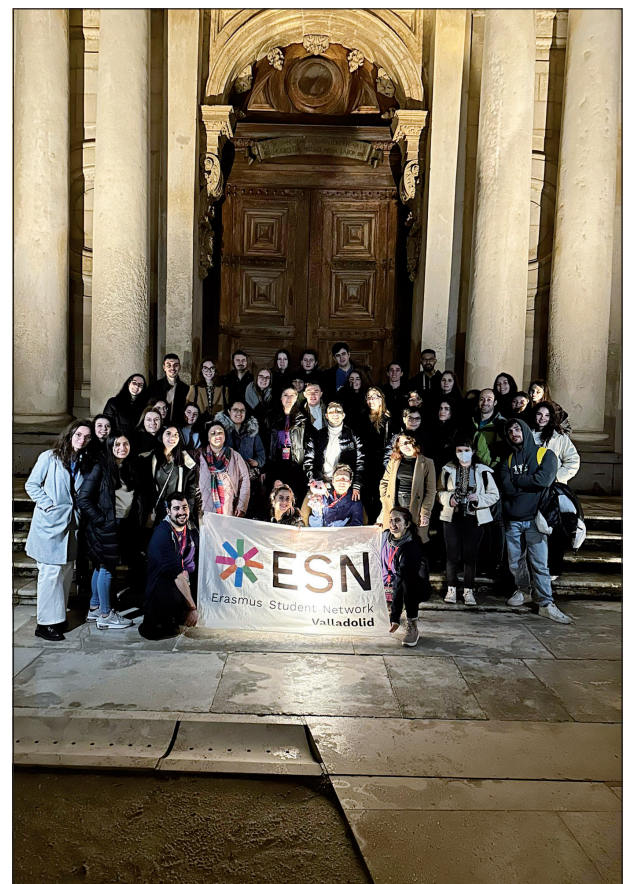
Reise nach Porto