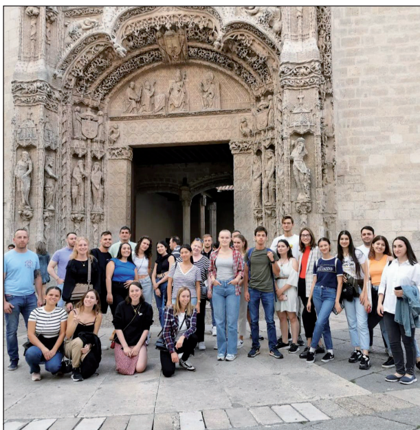
Einige ausländische Studenten bei einer Führung durch Valladolid

Valladolid oder Pucela, wie sie umgangssprachlich genannt wird, liegt im Nordwesten Spaniens und gehört zur autonomen Gemeinschaft Kastilien und León. Obwohl sie die bevölkerungsreichste Stadt der Region ist und die drei Selbstverwaltungsorgane beherbergt, gilt sie nicht als Hauptstadt. Allerdings war sie zwischen 1601 und 1606 unter der Herrschaft von Philipp III. die Hauptstadt des spanischen Reiches. In Valladolid, so die Spanier, spreche man das reinste Spanisch. Außerdem war die Stadt zwischen 1604 und 1606 die Heimat von Miguel de Cervantes selbst, der hier