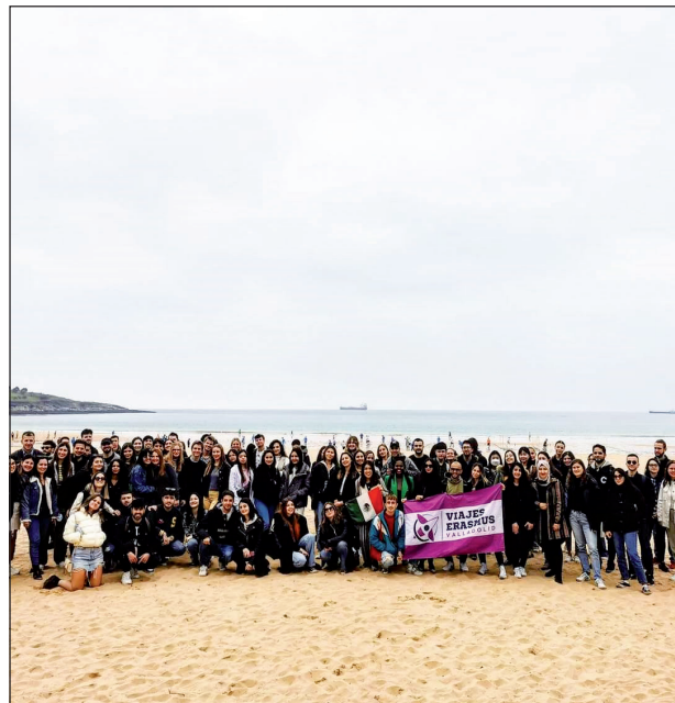
Erasmus-Studenten am Kantabrischen Meer